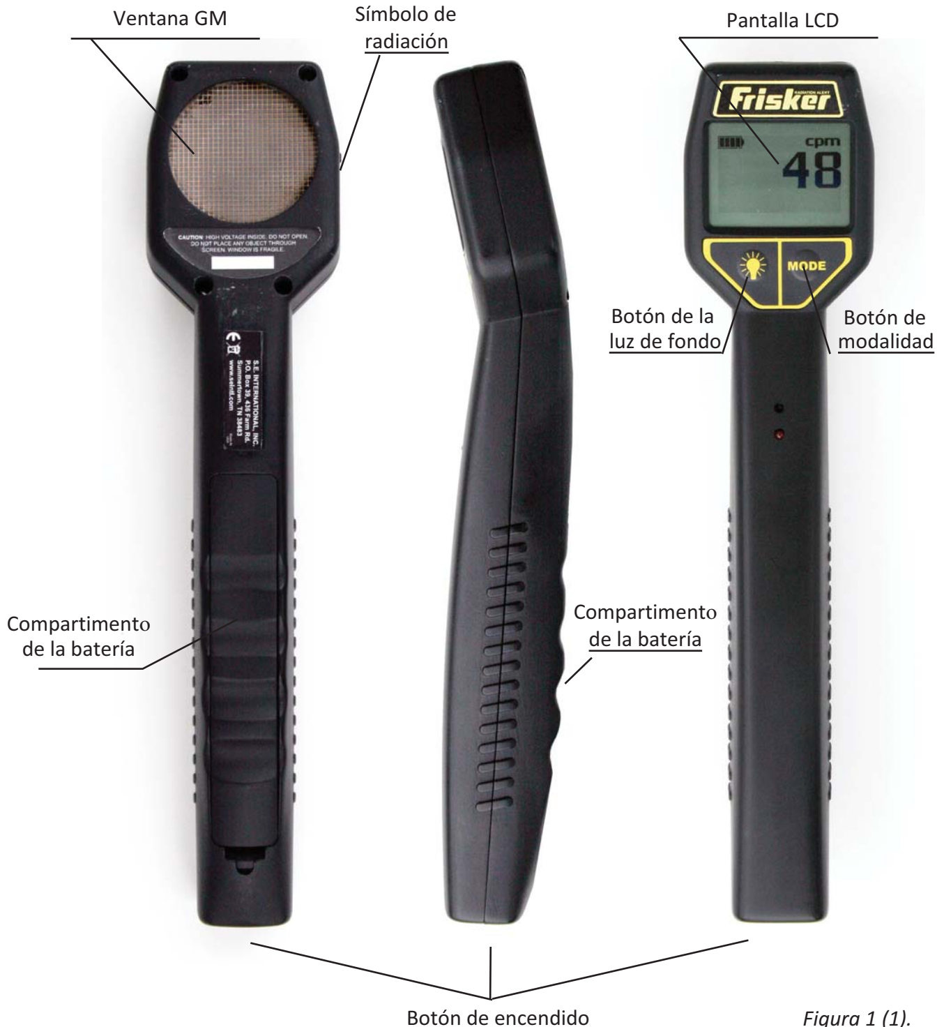
Figura 1 (1).

El Radiation Alert® Frisker utiliza un tubo Geiger de ventana delgada, de 2 pulgadas, comúnmente llamado un "tubo panqueque". La pantalla en la parte trasera del Radiation Alert® Frisker se llama Ventana GM Figura 1 (1) . Permite que la radiación alfa y beta y gamma de baja energía, las cuales no pueden pasar a través de la caja de plástico, penetren la superficie de mica del tubo. El pequeño símbolo de radiación en el lado de la caja indica el centro del tubo Geiger