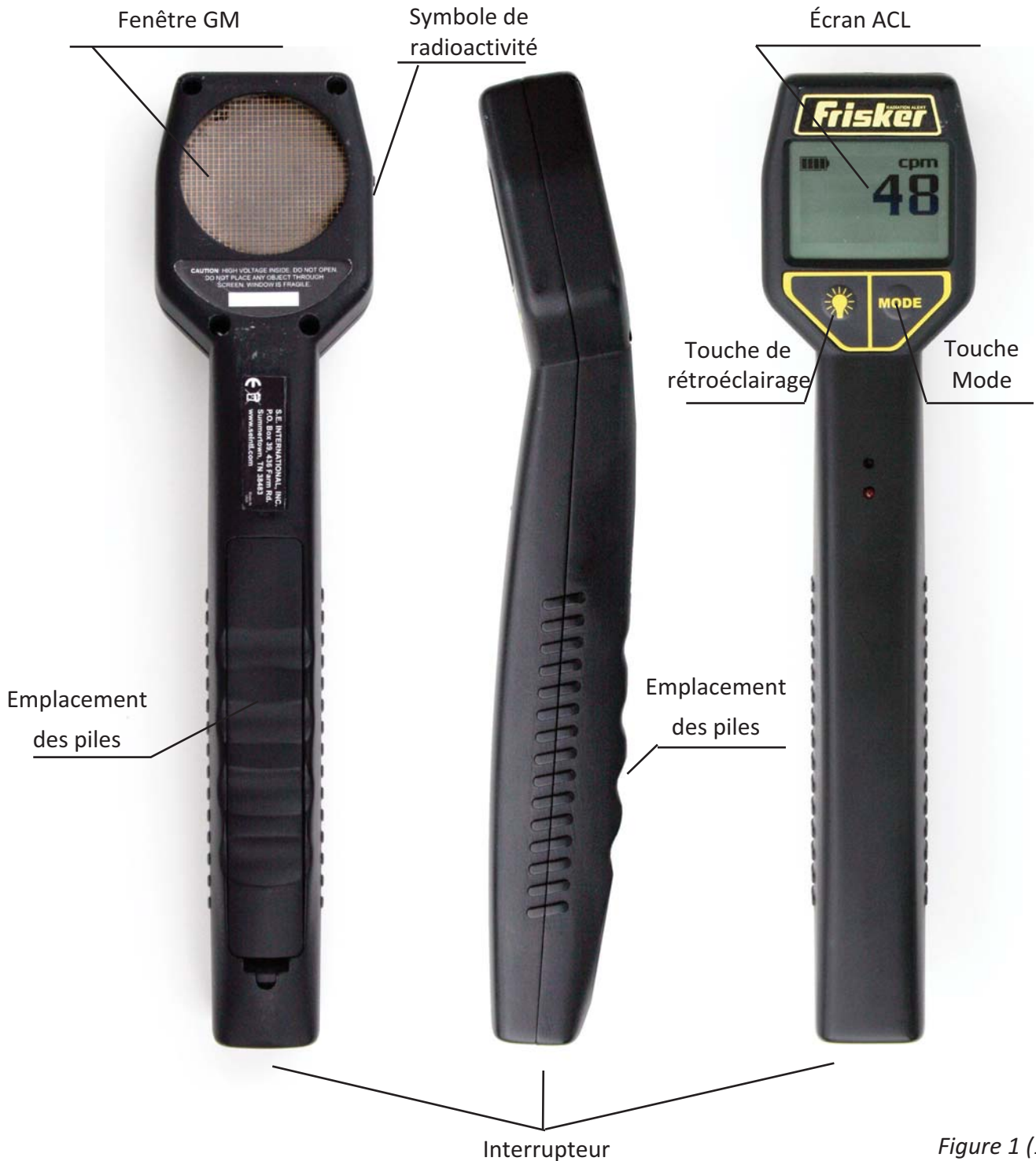
Figure 1 (1).

Le Radiation Alert® Frisker utilise un tube Geiger de 2 pouces, généralement appelé "compteur Geiger" ou "tube Geiger-Mueller", avec une fenêtre mince. L'écran à l'arrière du Radiation Alert® Frisker est nommé "fenêtre GM" (voir Figure 1(1) ). Elle permet aux rayonnements bêta et gamma à faible énergie qui ne peuvent pas pénétrer le boîtier en plastique, de pénétrer la surface en mica du tube. Le petit symbole de radioactivité sur le côté du boîtier indique le centre du tube Geiger.